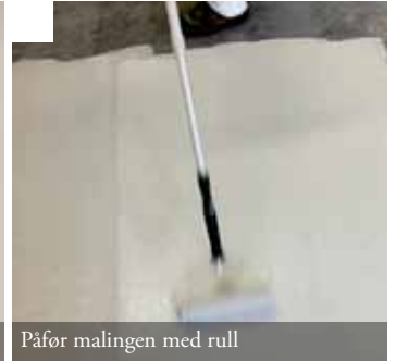
Påfør malingen med rull